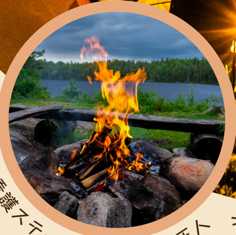
曙訪問看護ステーション有馬 正ト

介護予防事業で皆さん何してるの？ 普段の地域リハビリをブラッシュアップしましょう！ 座談会でOT同士語り合いませんか？