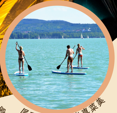
尾形医院 久米真菜 敬